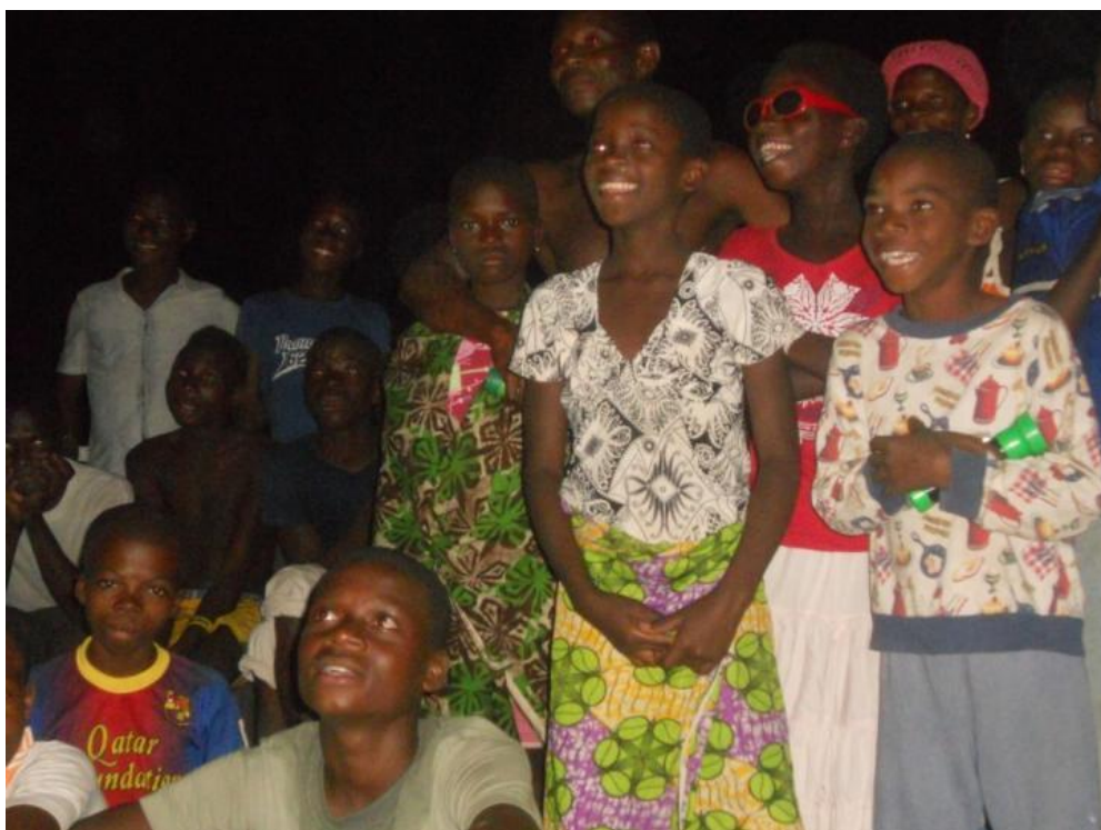
Le sourire des enfants pendant la projection vidéo

Les fusées viennent transpercer la nuit à Egokopé pour le plaisir de petits et grands, couleurs et pétards, c'est un Noël sons et lumières qui égaie le cœur de tous.