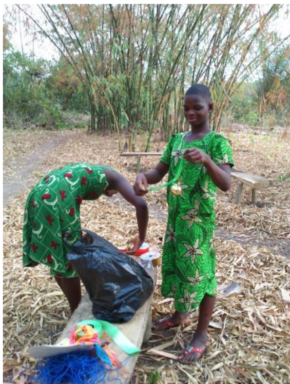
Décoration de la bamboueraie

Les dernières décorations sont installées dans la bamboueraie ainsi que la banderole NUAKE, soutenue par l'O.I.F., sur les lieux de réception.