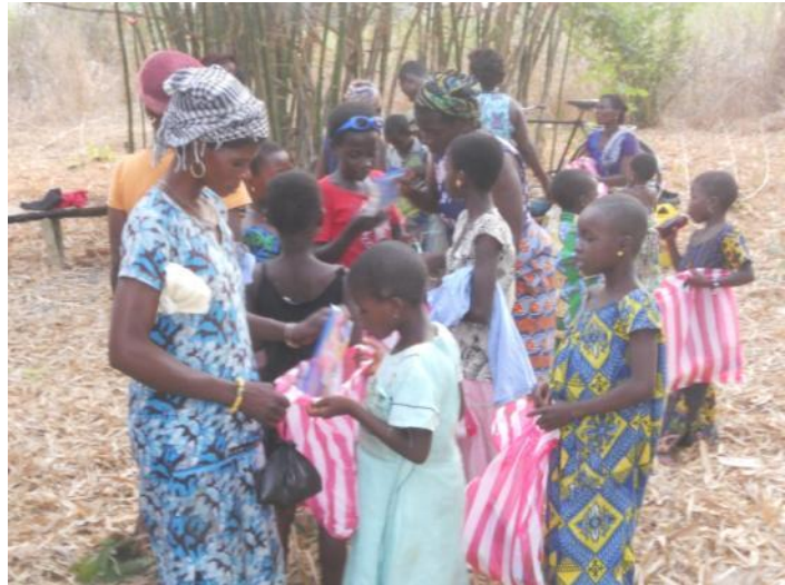
Les enfants reçoivent des kits scolaires pour Noël

Les plus jeunes jouent avec leurs cadeaux et les adultes sont en grande conversation sur les bancs. Le bissap coule à flot et les enfants sont appelés à se rassembler pour la distribution des présents. Vêtements et kits scolaires sont partagés pour la joie d'un Noël complet. Même les adultes se verront remettre des vêtements grâce à la solidarité dont à faite preuve les habitants de la capitale en collectant des friperies dans leurs armoires.